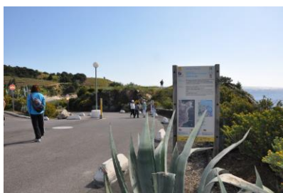
2 – Début de la randonnée