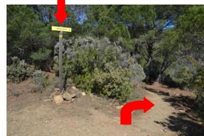
6 – Puis à droite pour suivre le sentier du littoral