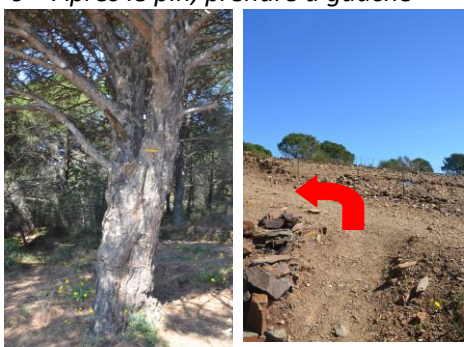
6 – Après le pin, prendre à gauche