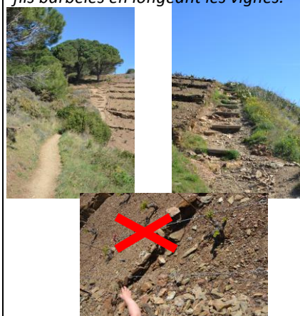
6 – Suivre le sentier et attention aux fils barbelés en longeant les vignes.