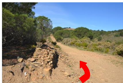
6 – Prendre à gauche