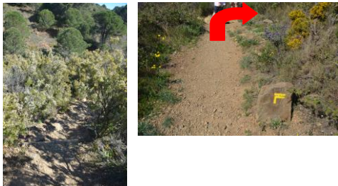
7 – Suivre le sentier puis prendre à droite à l'intersection