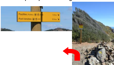
8 – Suivre les panneaux, continuer le chemin puis prendre à gauche