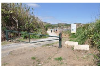
10 – Suivez la route, passer la barrière et longer une crique