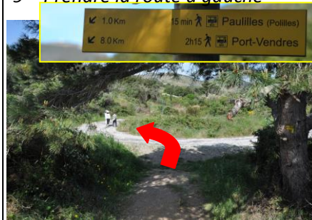
9 – Prendre la route à gauche