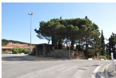
1 - Arrêt des bus