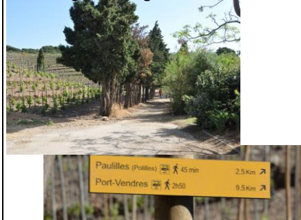
3 – Longer les vignes en terrasse