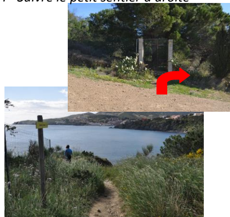
4 – Suivre le petit sentier à droite