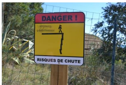
5 – Longer le bord de mer et attention, ne pas courir.